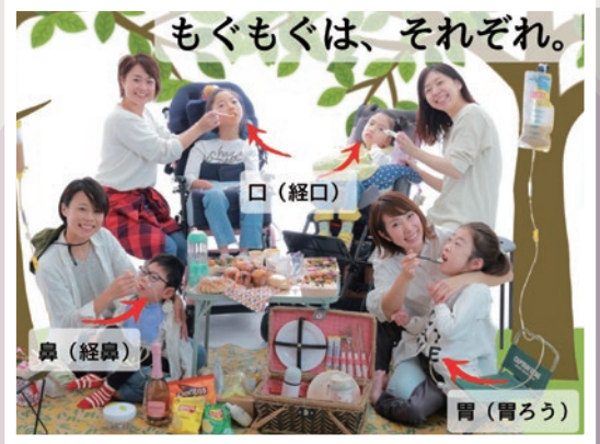
摂食嚥下障害のある子どもを育てているスナック都る美のママ さくらママ・れいこママ